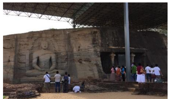
アクアメイク設置場所となるポロンナルワ